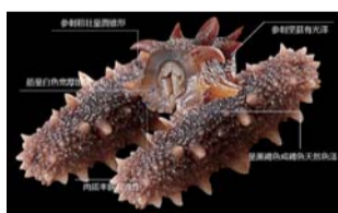
图解：“冬季海参节”为啥最省钱