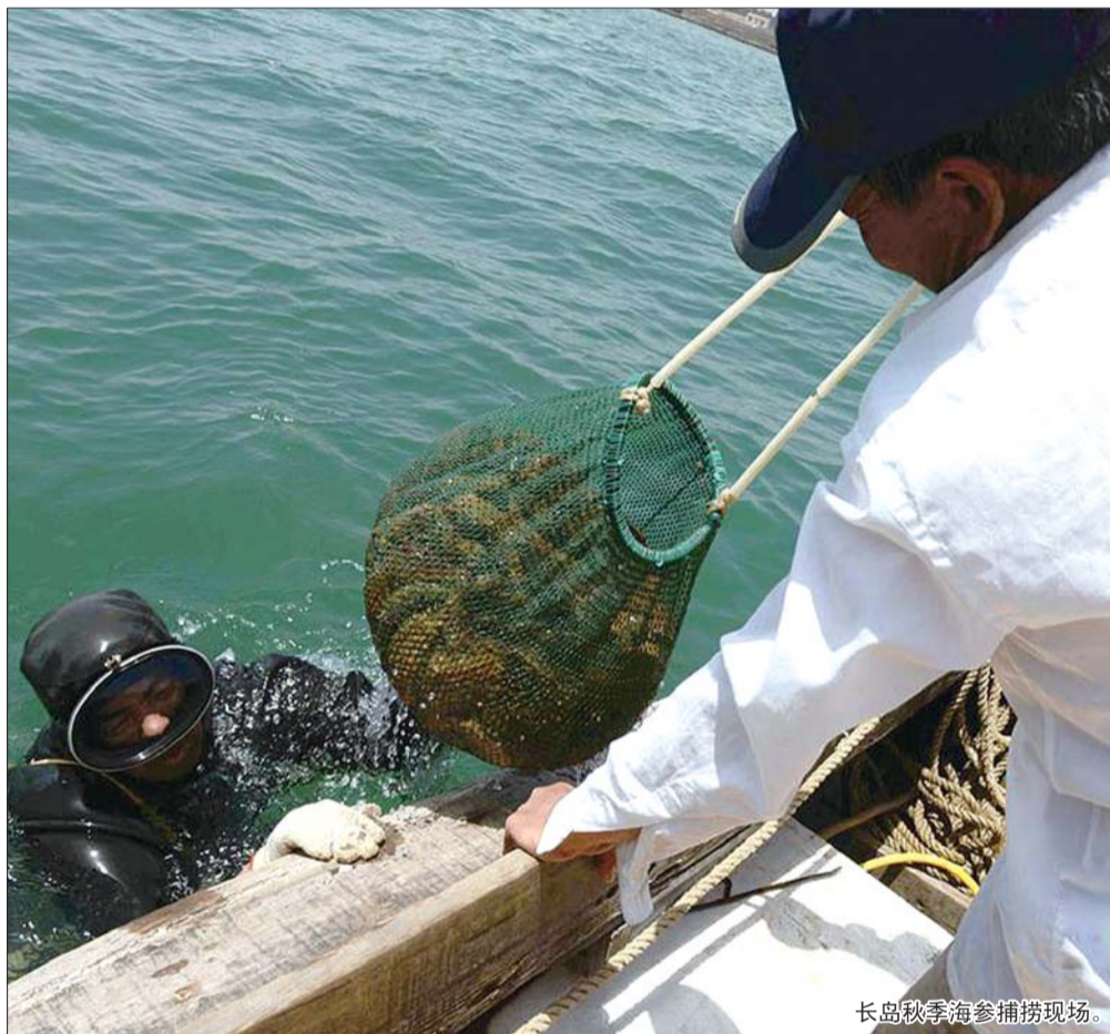
长岛秋季海参捕捞现场。

从西医的角度来说，海参中的精氨酸是构成男性精子细胞的主要成分，且具有调节性激素的功能，而且海参又恰恰是“精氨酸的大富翁”，对治疗阳痿、肾虚有特殊功效。另外，海参中的磷、锌、锰、硒、镍等元素都对人体多种生理活动，尤其对生殖功能作用突出，对促进性功能的提高很有帮助。美国科学家通过研究发现，男性食用海参有助于增加精子数量和提高精子质量，再加上适当的体育锻炼和保持健康的体重。