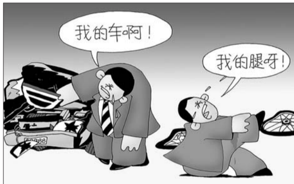
出事才知道疼 尚军 绘