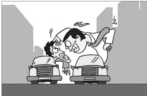
互拍 尚军 绘

仅仅为了节省几分钟的时间,轿车车主及骑车人置安全、道德于不顾,除心存侥幸外,只能用对法规缺乏敬畏之心来解释了。我认为,无论是侥幸心理作怪,还是藐视法规的无知,都应当算是一种交通陋习,而这种陋习的直接后果就是无法形成安全的交通环境,每个交通参与者的生命安全都会因此受到威胁。