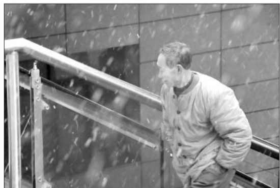
7日是农历大雪节气,港城飘起小雪,市民从火车站外走过。