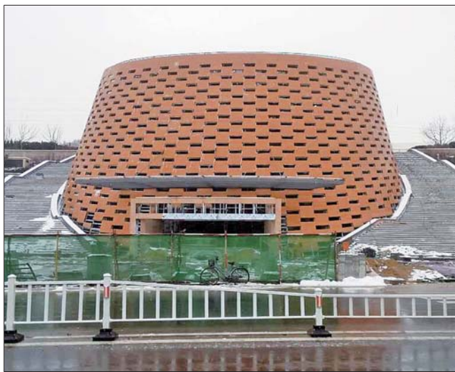
▲威海北站站前广场的椎体造型