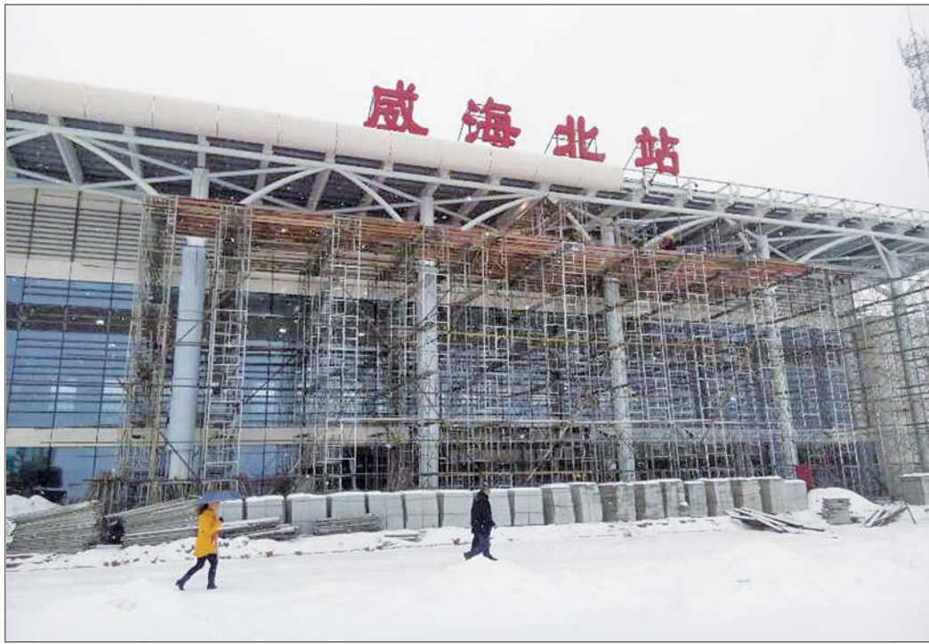
▲威海北站站房建设进入收尾阶段

交警支队还制定了相关保障措施。如果化北站周边4条道路(世昌大道、环山路、科技路、沈阳路)及相关的4个路口,提高车辆通行能力;设置中央隔离护栏1300米,增设限速、禁停、注意行人等标志20余块,增设电子测速2处,视频监控2处;在环山路、科技路、沈阳路、世昌大道等关键路口新增大型指路标志10处,路名牌5处,大型绕行标志2块,停车场提示标志2处,对现有指路标志增设“威海北站”等牌子。