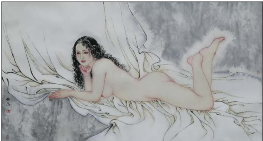
▲《静夜》 2013年 90x180cm