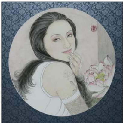
▲《四季之夏—荷之洁》 2013年 34x34cm