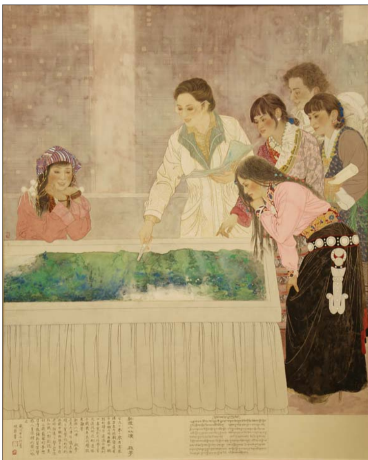
▲《新授人以渔——启梦》 2014年 180x210cm