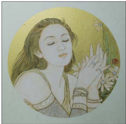
▲《四季之秋—菊之幽》 2013年 34x34cm