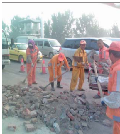
▶环卫工人每天清晨都能在限高杆处清理出大量建筑垃圾。