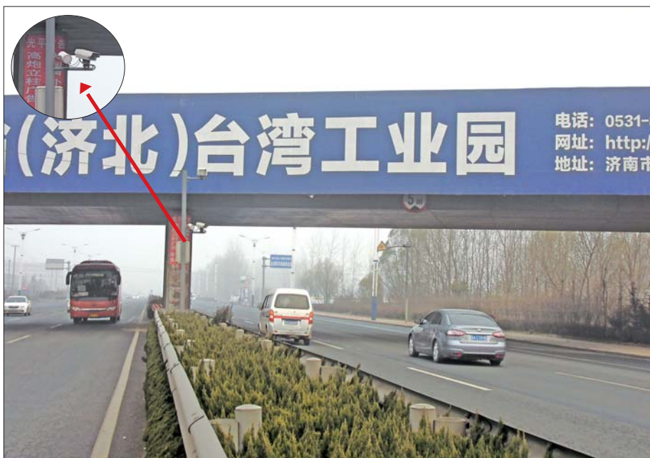
▲该路段宽阔平坦,车流量相对较小,测速抓拍摄像头距离桥下50米左右。