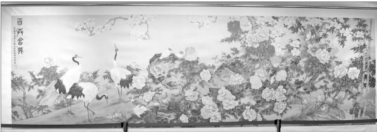
巨幅合作画《百卉含英》

本报讯(记者 霍晓蕙) 12月14日上午,由大众报业集团等单位主办的“关照自然 乐道丹青”——中国工笔花鸟画名家展,在位于大众传媒大厦四层的山东新闻美术馆开幕,展出的近百幅工笔画,呈现出乐道丹青的优雅,宛如一阵清新的风,带来涤虑净心的诗意。