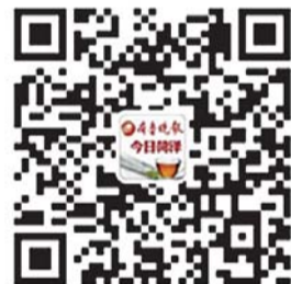
齐鲁晚报今日菏泽 官方微信二维码

据介绍,目前菏泽家居建材行业面临洗牌期,电商与传统家居卖场的联合将会给消费者带来更多的选择方式。