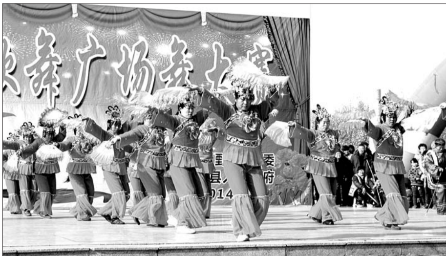
伴随着阵阵锣鼓,参赛群众跳出了精气神。

鄆城县委书记谷瑞灵告诉记者,秧歌舞、广场舞是群众乐于参与的重要文化体育活动,既可以强身健体、愉悦心情,又能培养乐观向上的生活态度,养成健康文明的生活方式,推动邻里和睦、社会和谐。正因为如此,为顺应群众所盼,今年以来,全县各级都把秧歌舞蹈队建设作为一项基础工程和民生工程来抓。进入12月份以来,各