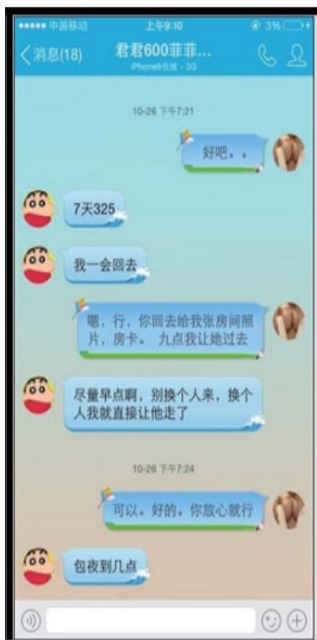
犯罪嫌疑人在网上的聊天记录。

据了解,现九名组织、协助组织卖淫的犯罪嫌疑人被依法逮捕,一名被取保候审;涉案卖淫女被处以强制戒毒、收容教育、行政拘留等处罚;涉案嫖客被处以行政拘留15日,并处罚款。