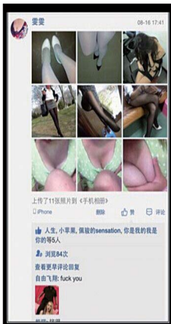
犯罪嫌疑人QQ空间里的美女图片