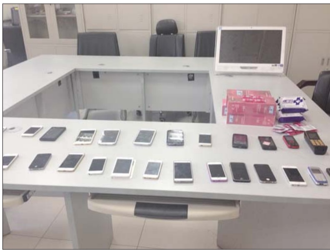
警方缴获电脑、手机、避孕套等大量作案工具