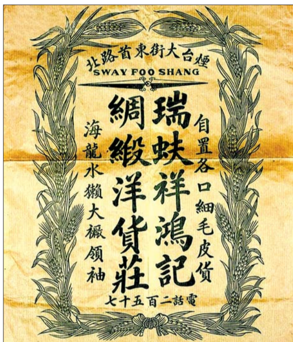
烟台瑞蚨祥民国时期广告。

瑞蚨祥把顾客“活财神”分为高、中、低三等:权贵名流等上层社会人物为上等,普通有产者为中等,一般消费者为低等。瑞蚨祥以高、中二等顾客为主要财源,同时不放弃低等顾客。经营者常说:“为商者重在获利,欲达此目的,就必须在骑马坐轿人身上打主意,至于那牵马拾轿的,在他们那里是抠不出钱来的。”(《遐迩闻名的“祥”字号》,济南出版社1991年版。瑞蚨祥制定了严格的铺规,要求店员全程热情周到地为顾客服务。店员不但要善于察言观色、揣度心理,掌握营销的主动