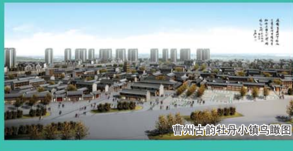
曹州古韵牡丹小镇鸟瞰图