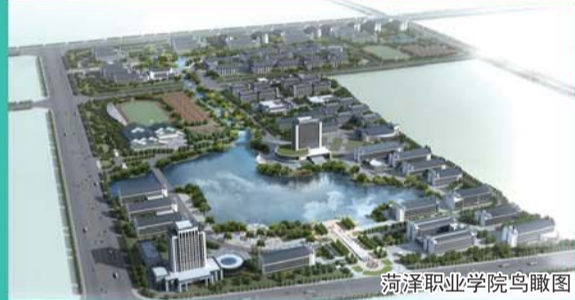
菏泽职业学院鸟瞰图