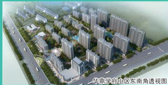
华鼎学府小区东南角透视图