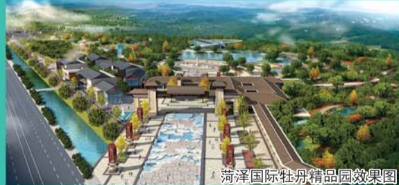
菏泽国际牡丹精品园效果图