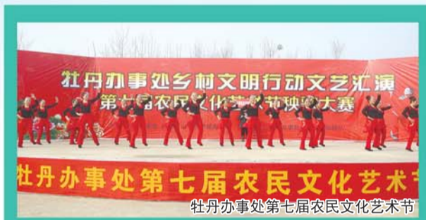
牡丹办事处第七届农民文化艺术节

牡丹办事处的宏伟蓝图已经绘就,全处干部群众用智慧和汗水书写着牡丹文化旅游新城建设的五彩华章,用务实和进取践行着“崇文尚德、务实图强”的菏泽精神,我们坚信在市委市政府和区委区政府的正确领导下,一个充满生机活力、富裕美丽的牡丹之乡、园艺之家、宜居之城、兴业之都迅速崛起,牡丹办事处将犹如一颗璀璨的明珠镶嵌在菏泽锦绣大地!