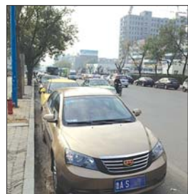
18日,龙潭路中心医院两侧车辆排起长队。

建设、水利、交通、规划、园林等方面的专家对方案进行了严谨周密的论证;邀请建筑结构、水电安装、通风空调、消防等专家对施工图进行了严格审查,做到高端设计、精心施工。此外,山东农业大学、中心医院都派出专人协调配合停车场的施工,龙潭路地下停车场启用,离不开各方面的大力支持和帮助、配合与协调。