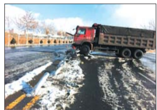
货车撞坏护栏后停在路上。

本报热线6610123消息(记者于飞) 21日中午,在高新区望杆墩附近,一辆大货车为躲避一辆打滑的私家车,撞坏了20米的护栏。货车司机说,破损的护栏插到了车底下,发动机受损严重。除了车受损外,司机还要承担护栏的损失。