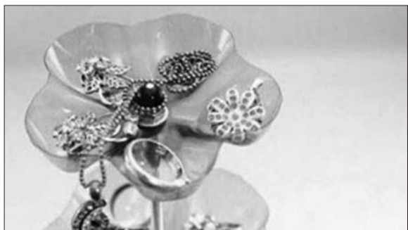
图3:不要怀疑,这就是你喝完的汽水瓶,竟可成为如此漂亮的首饰支架,以后女孩子们再也不用担心自己的耳钉找不见了。