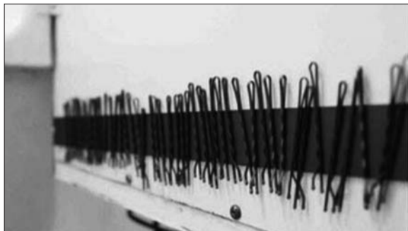
图2:发卡丢了一堆又一堆,除了放在收纳盒里,还可以用一片长条带来解决。既不容易丢还容易拿,必要时还能做装饰。