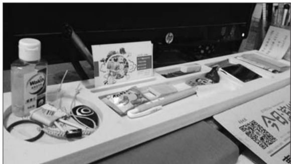
图1:同事小爽的办公室收纳盒,什么便签、笔芯、头绳,统统收!整个办公桌看起来好清爽。

无论在办公室还是在家里,总有理都理不干净的琐碎物品,放在明显处碍事,扔到清静处用时着急。看看本期为您精心准备的收纳系列,拿出“女主人”风范,先管好那些零碎品。