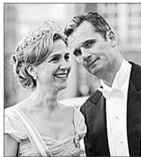
克里斯蒂娜与丈夫乌丹加林

卡斯特罗法官将克里斯蒂娜列为案件嫌疑人时曾遭到西班牙反腐败检察官的反对,后者认为“没有迹象表明”公主参与其丈夫公司的活动。检方一度呼吁法院搁置这一案件的审理。不过,先前有媒体报道,作为“诺斯基金会”董事会成员,克里斯蒂娜不但对丈夫的做法知情,还把一部分“赃款”用于个人开销。同时,调查人员怀疑克里斯蒂娜夫妇利用共同拥有的一家公司洗白赃款。