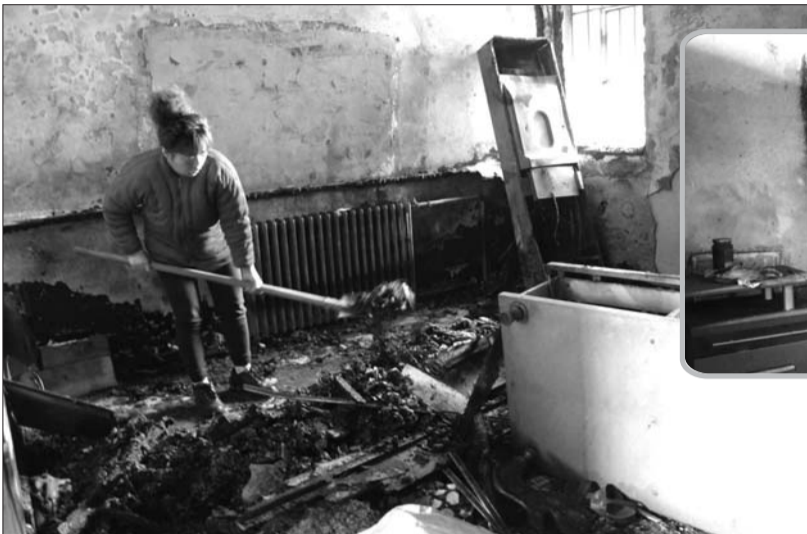
▲家里大部分电器都被烧毁。本报记者 岳茵茵 摄