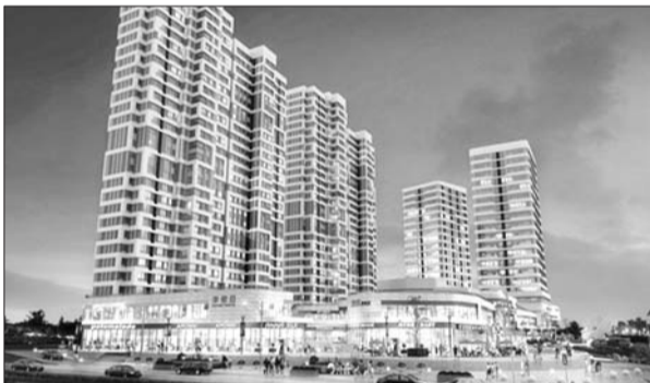
宝龙城市广场项目效果图。

不仅如此,宝龙城市广场的综合体物业,为日常吃喝玩乐住提供最大便利,项目一层二层为时尚商业街,汇聚多种产品,包含的品类丰富,完全满足日常高端生活需要。另外,项目配套大型shopping mall,同时引进世界500强品牌商家进驻,为宝龙业主及烟台市民提供国际化、时尚化的购物体验。