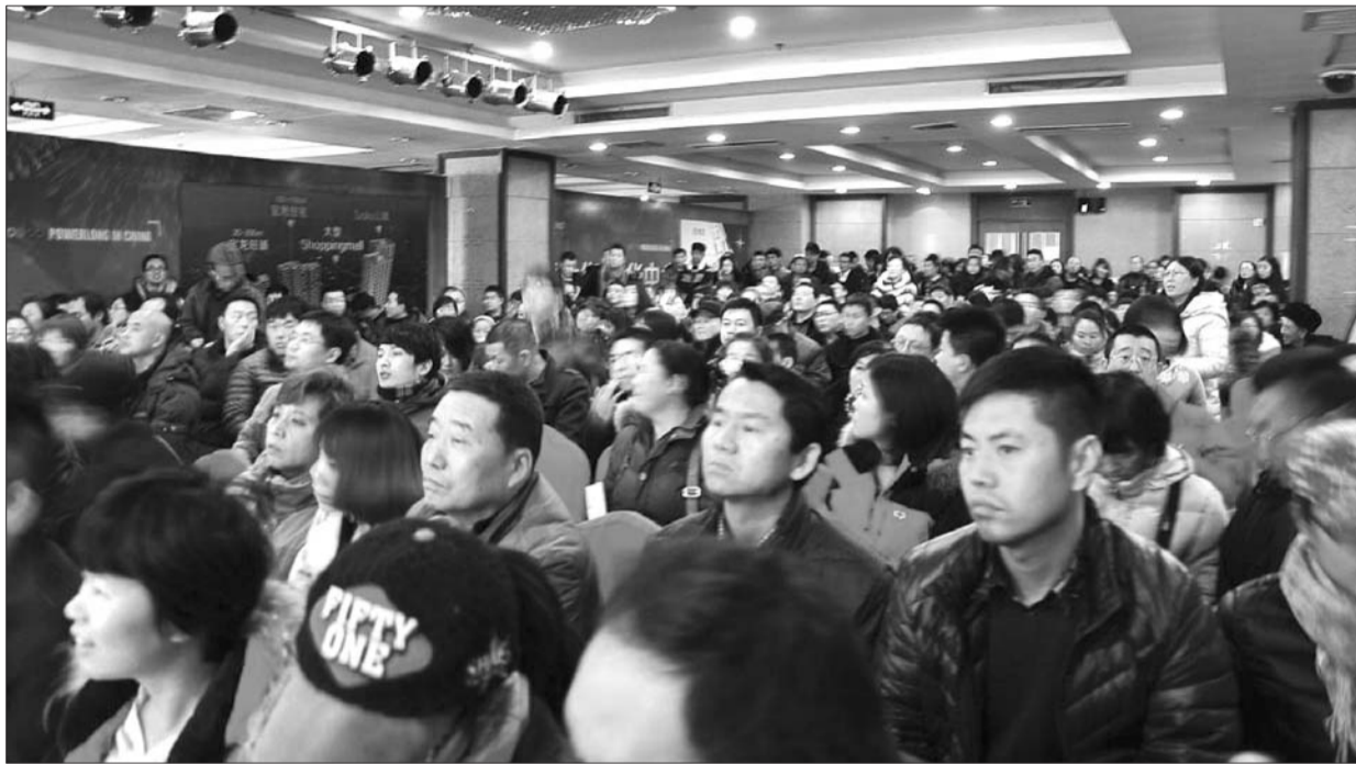
宝龙城市广场开盘现场热闹非凡。