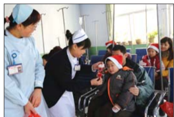
护士们为孩子送礼物。