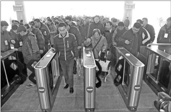
▲在即墨北站,城铁到站后,市民刷票通过检票口。