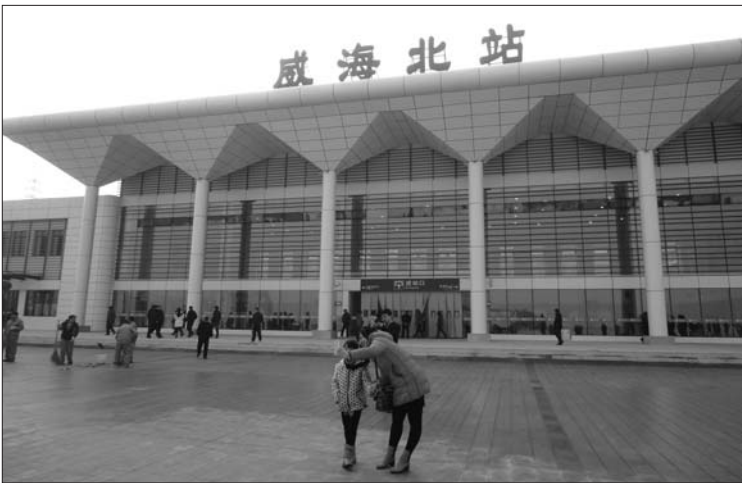
图为市民带着孩子在城铁北站广场拍照。