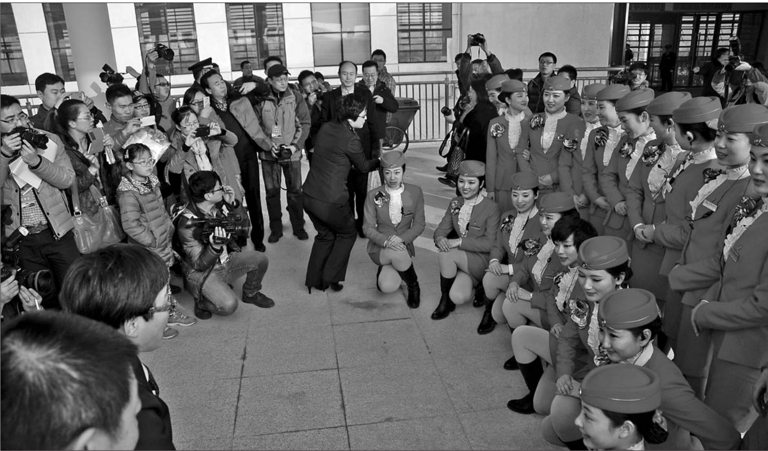
▲动车到达荣成站后,“动姐”成为记者和摄影爱好者镜头中的焦点。

与普通火车相比,动车发动或停驻时都没有轰隆隆的声响。据悉,高速动车组采取了“隔、降、吸、减”方法,通过13项450多次的实验室和实车测试,最终实现了列车在时速300公里运行时,车内一等座客室的噪音不超过65分贝,二等座客室的噪音不超过68分贝,这仅相当于普通室内轻声谈话的音量。