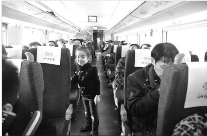
▲“我也来体验动车。”