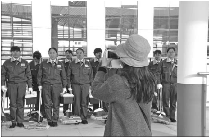
▲卫生员也成了动车线路上的风景线。