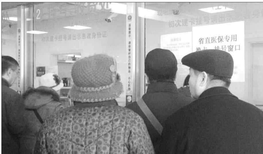
6日,齐鲁医院省直医保专用换卡挂号窗口,市民正在咨询。