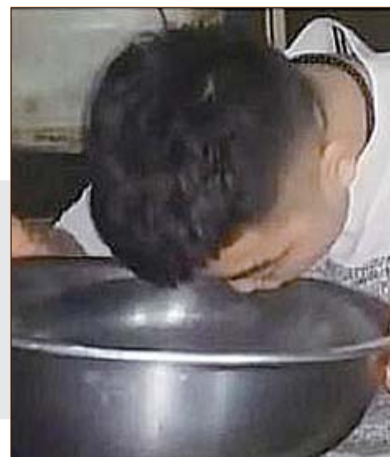
网络上很多人在拍摄拼酒视频。