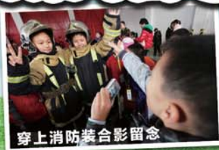
穿上消防装合影留念