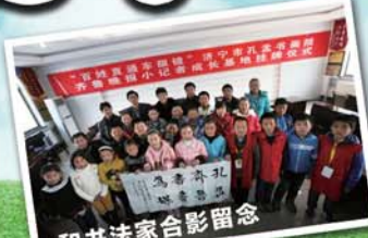
和书法家合影留念