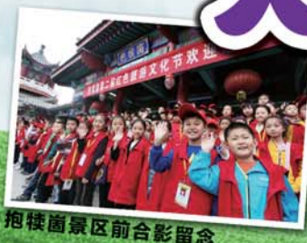
抱犊山景区前合影留念