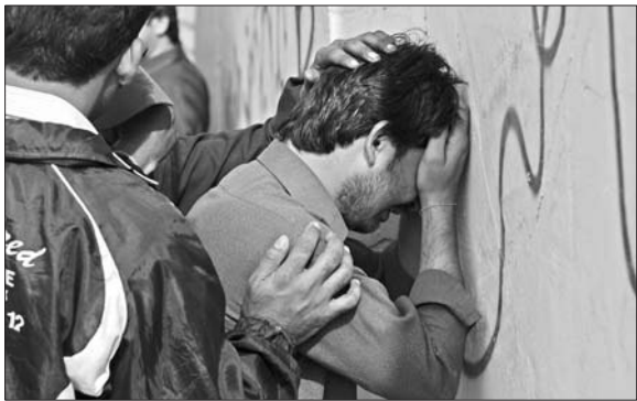
11日,车祸遇难者亲属在巴基斯坦卡拉奇一家医院外哭泣。