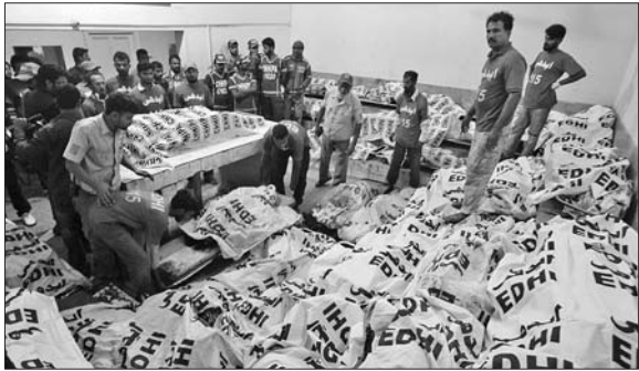
11日,在巴基斯坦卡拉奇一家医院,救援人员搬运车祸遇难者遗体。

2014年11月,一辆客车在卡拉奇以北450公里的海尔布尔地区与一辆载煤卡车相撞,造成至少57人死亡,其中包括18名儿童。警方事后认定,道路状况不佳和缺少警示标志是导致车祸发生的原因。