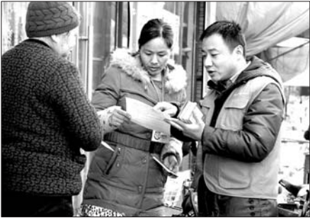
本报蚂蚁义工向市民宣传爱鸟护鸟知识。

本报东明1月11日讯(记者 李德领 通讯员 张海峰) 10日,由本报蚂蚁义工团东明分团联合东明县黄河义工团发起的“同在蓝天下人鸟共家园”爱鸟护鸟宣传倡议活动走进东明县长兴集乡(黄河滩区),为当地市民宣传爱鸟护鸟知识,这也是本报义工第13次走向乡镇进行宣传爱鸟护鸟知识。此次活动所用的《鸟类与人类的关系》、《保护鸟类倡议书》等5000份宣传资料由东明县少林佛汉拳研究会赞助。 “不伤害、捕杀野鸟,不掏鸟窝”、“拒食野鸟等野生动物,并劝诫亲朋不食用野生动物”……10日,本报蚂蚁义工们走进长兴集乡,向市民发放《鸟类与人类的关系》、《保护鸟类倡议书》等宣传页,并耐心讲解爱鸟护鸟的相关知识。不少市民表示要保护