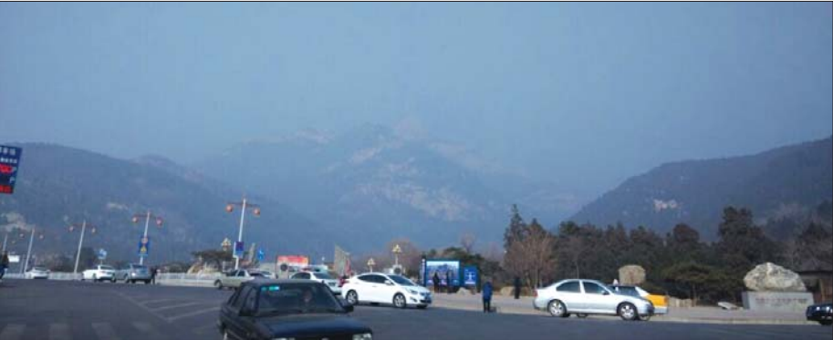
11日白天空气能见度未见好转。

本报泰安1月11日讯(记者 路伟) 11日下午2点20分,持续了两天的霾黄色预警信号解除。未来三天,天气以晴到少云为主,气温有所回升,风力维持在三级左右。 9日下午,泰安市发布霾黄色预警信号,9日至11日,全市大部分地区出现中到重度霾,空气质量下降明显。11日上午,泰城空气能见度仍然很低,从