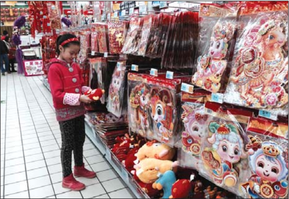
一超市内新年饰品“羊”造型火了。

本报泰安1月11日讯(记者 陈新) 虽然距离农历羊年还有一个多月的时间,但是带有羊元素的商品已经提前预热,“羊饰品”造型卖萌,销量看涨。