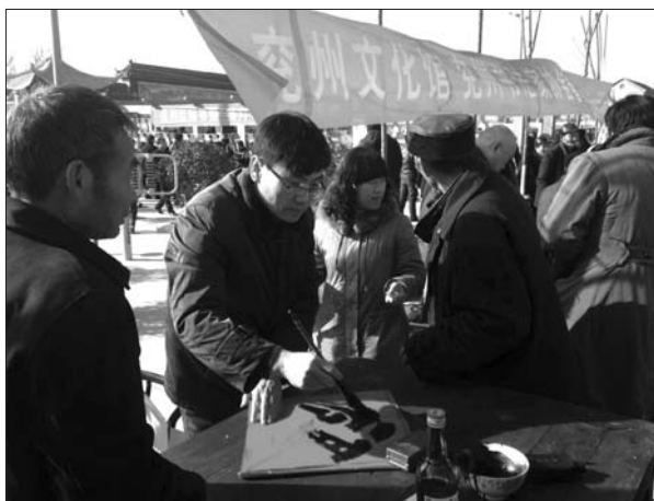
表彰活动后,书画家还现场书写福字赠送附近居民。