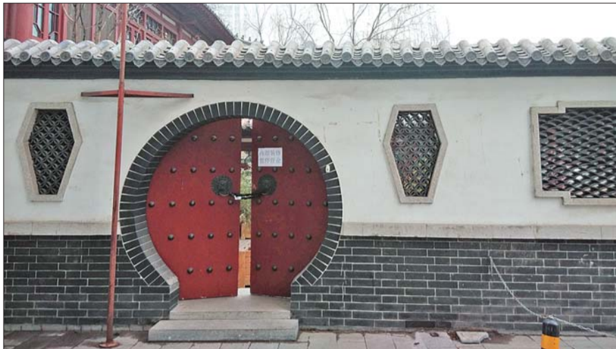
天镜泉(江家池)所在小院的门锁。

记者按着陈先生的介绍,来到小院的西门,不过此时西门被锁上,没法进门赏泉。记者看到,门上贴有“内部装修,暂停营业”