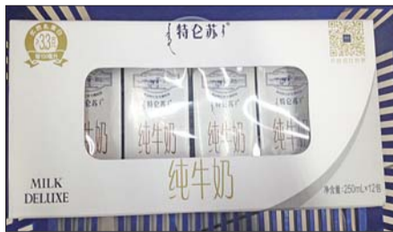
特仑苏纯牛奶。