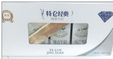
特仑经典奶箱设计像特仑苏纯牛奶。

打开奶箱取出奶盒,无论在图案、颜色还是线条上,特仑经典的奶盒设计都很像金典有机纯牛奶。二者均为白底蓝字。大大的“经典”白色字样用绿色方框衬托。