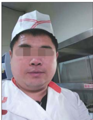
厨师服暴露了嫌疑人身份。