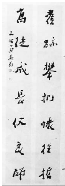
书法·旧迹高徒行书七言对联。