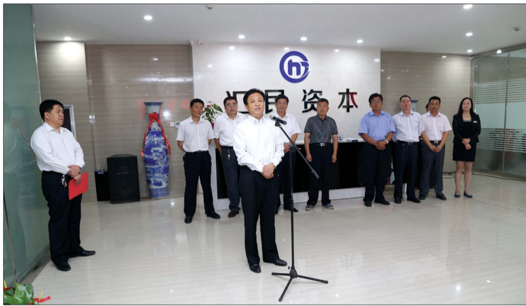
巨野县政府、人大及市县金融办负责人出席开业揭牌仪式。

山东巨野汇民间资本管理有限公司是经菏泽市人民政府批复正规合法的民间资本管理有限公司,公司严格根据省、市政府《关于进一步规范发展民间融资机构的意见》进行运营,致力于为中小企业,微型企业,个人客户,农业客户提供民间投融资服务。