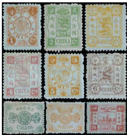
大清龙票已被国家博物馆永久收藏。