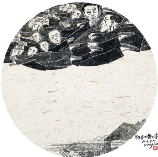
◀ 浮生·在田野上空 60x60cm

张向军 山东滨州市文化馆副馆长、滨州美术馆馆长，馆员，从事油画创作 毕业于山东艺术学院 滨州市九届、十届政协委员 滨州美术家协会副主席 滨州油画学会副主席 滨州艺术理论研究会副主席 中国美术家协会山东分会会员 作品强烈表达个人情怀，完全靠才情和阅读支撑创作，关门读书，闭门造车。 认为艺术感觉和绘画才能是天生的，无需努力和勤奋 油画作品曾获国家文化部“群星奖”。在从事油画创作的同时，参与水墨绘画与平面美术设计实验。是一个计算机图形软件的狂热者。