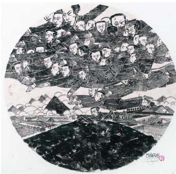
◀ 飞越大地 丙烯 中国墨水 麻筋纸 60x60cm