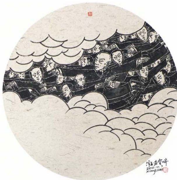
◀ 浮生·在云端 60x60cm