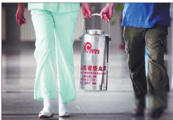
山东省脐血库工作人员运送脐带血造血干细胞至移植医院。(资料片)

《血站执业许可证》的脐血库仅有位于济南的山东省脐血库。2008年,山东省卫生计生委专家组对山东省脐血库进行了执业验收,通过听取汇报、现场检查、查看文件、质疑问答,专家组一致认为其符合国家卫生计生委有关规范,达到执业标准,同意颁发血站执业许可证。