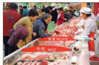
市民在超市选购肉类。