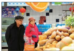
市民在超市选购新鲜的蔬菜。

据悉,虽然预计今年物价将继续在低水平运行,但市物价局也将做好各项调控工作,确保物价总水平稳定。