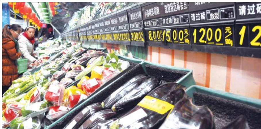
临近春节,菜价普涨。