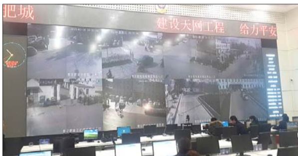
肥城市公安局天网工程监控画面。本报记者 刘真 摄

心”工程,提高了群众安全感满意度,在省公安厅开展的2014年度群众安全感和满意度调查中,肥城群众安全感为98.45%,满意