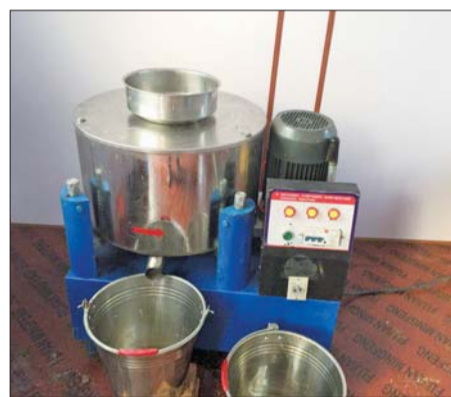
⑤对压榨的特级花生油进行离心脱磷灌装。