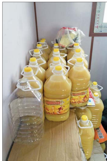
④对压榨的特级花生油进行沉淀后灌装。