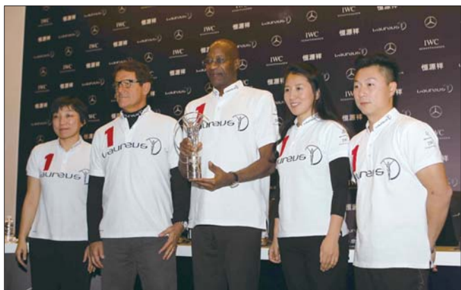
2月11日中午,2015年劳伦斯世界体育奖提名新闻发布会在上海举行,摩西、李小鹏等五位体坛传奇共同揭晓最终入围者名单。

劳伦斯世界体育奖被视为国际体坛的最高荣耀,将于4月15日在上海大剧院举行颁奖典礼。值得一提的是,中国奥委会合作伙伴恒源祥集团为本届劳伦斯世界体育奖的主办方,这是劳伦斯奖历史上首次由一个企业主办。(宗禾)