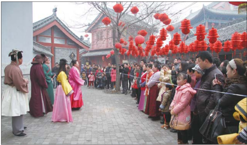
阳谷狮子楼旅游区的水浒情景喜剧《相亲》(资料片)。

今年的贺年会,聊城更是民俗年味十足,从元旦到春节再到元宵,各类精彩活动,突出“水浒文化、温泉休闲、养生文化、祈福迎新”的水城特色,推出具有聊城民俗元素和文化特色的贺年会产品,真是好吃的、好玩的、好看的一应俱全。