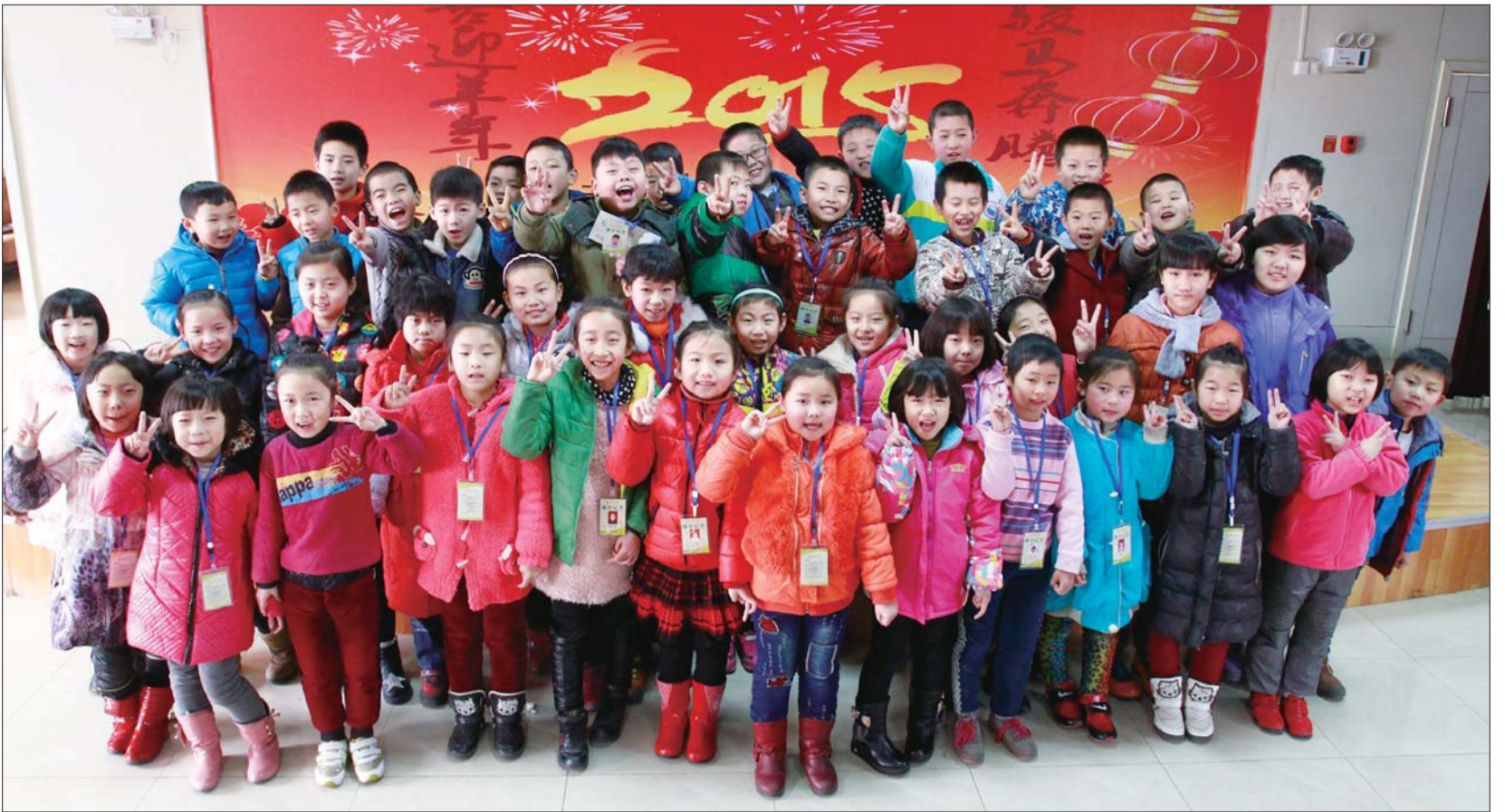
春节即将到来,本报小记者们送祝福。