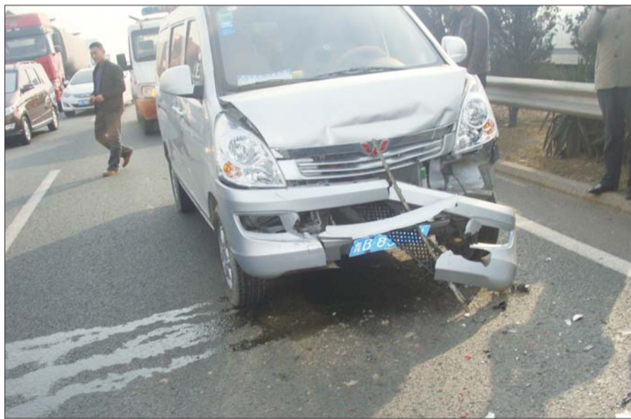
一辆面包车车头被撞烂。

青银高速淄博路政人员提醒,高速上一定要保持好车速与车距,特别是在一些重大节日期间,由于大家急切赶路的心情导致不按规定行车,引发一些危险事故。