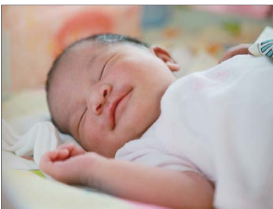
2014年8月11日,萌仔宝宝出生第五天,熟睡中。