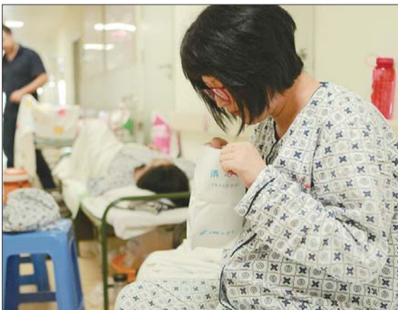
2014年8月5日,孕267天入院待产,仍然孕吐不止。