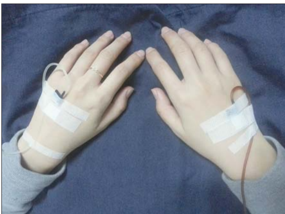
▲2014年1月5日,孕55天,住院保胎,左右开弓。

人生,总有许多沟坎需要跨越。这一年,我们用爱与希望汇集起勇气和力量,共同见证了温润沁心的精神成长历程,坚强乐观地担当生活赐予的百般磨炼,迎接家庭新成员的诞生加入,五味俱足,幸福所在,感谢有你!