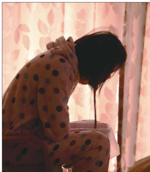
▶2014年2月3日,孕84天。全天候无缝隙妊娠剧吐愈演愈烈,当天更是吐出胆汁和鲜血,体重比孕前减少十斤。