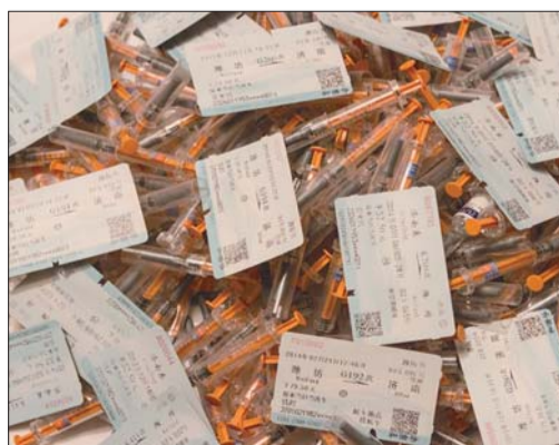
每一个注射过的针管,每一张往返潍坊产检的车票,均记录着孕期艰辛的历程。