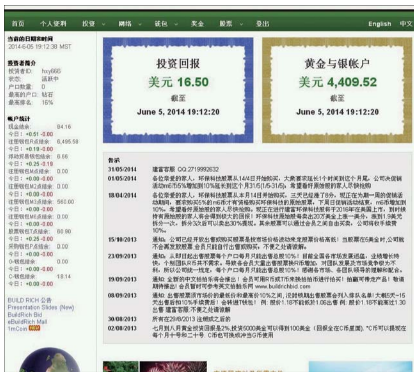
网络传销的网站截图。虽然账户上显示有回报,却无法提现。

一名寿光籍男子参与了一个名为“英皇建富”的投资项目,并缴纳了4000元“入会费”。山东省寿光市公安局经侦大队根据这一条小线索,深挖出了一个特大跨国传销网络,涉及20个国家和地区,人数共计8万余人,涉及金额1.1亿余美金,约计人民币7亿元。3月2日,记者获悉,寿光警方将情况上报公安部,公安部随后发起集群战役,目前全国17名传销头目被抓获,其中寿光抓获高层组织领导者7人。