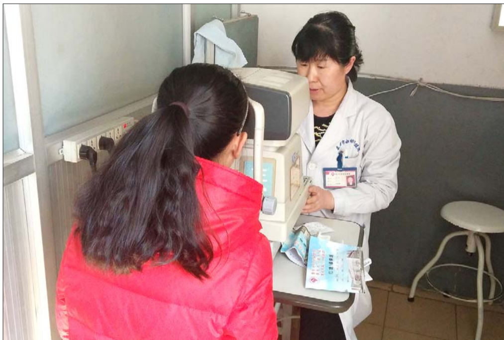
医生正为一名女孩验光。