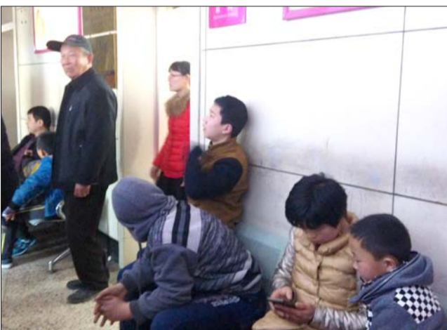
不少孩子和家长在走廊候诊。

随着电子产品的日渐普及,近视小龄化也越来越严重。这一现象引起了许多家长的热切关注。“长时间近距离看东西是导致近视的主要原因,假期期间,不少孩子的时间都被手机、电脑夺走,另外孩子学画画、弹琴、长时间近距离拼图也是长时间近距离视物,都是导致近视增长的原因。”孙梅说,