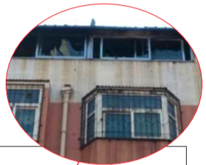
▼顶棚的玻璃已经被烧炸。