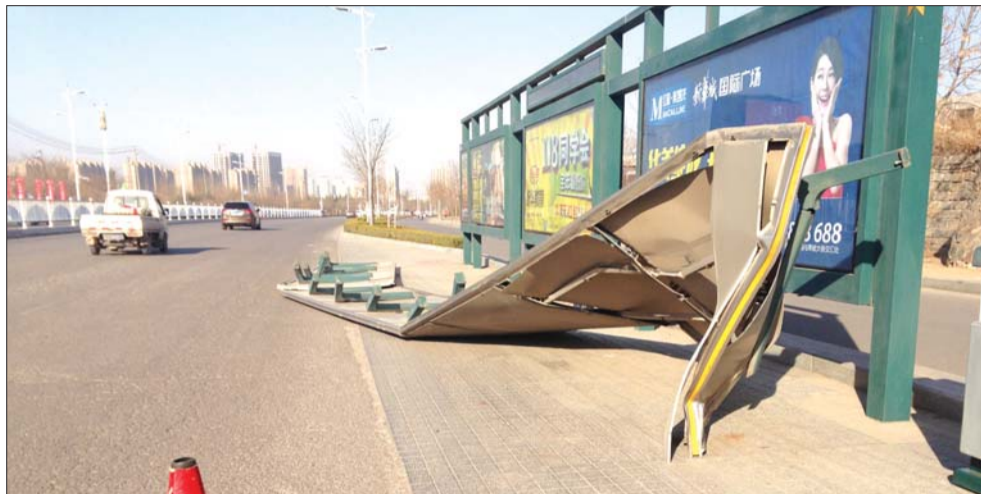
◀公交站亭顶棚被撞翻在地。本报记者 赵兴超 摄

泰安海逸风公司相关工作人员介绍,他们4日早上发现候车亭被撞,查看现场后已向警方报案。候车亭高近六米,设计符合公交车高度,应该是被大型超高车辆撞击。在候车亭两侧高五米多的位置,都贴了反光警示贴,夜间会反光提醒司机注意高度。工作人员说,肇事车辆已经离开,警方正调查沿途监控,希望司机主动出面。