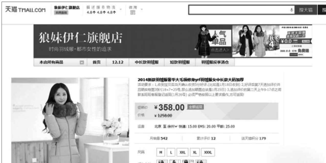
网店宣传图, 现在该店已搜索不到了。