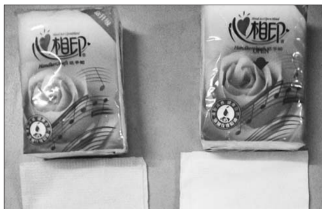
右为超市“心相印”纸巾正品, 包装颜色比较亮。

度也多了将近三分之一。拆开以后纸的差别就更大, 超市买来的纸巾表面柔软, 纸面上印有“心相印”的标志, 有淡淡的香味; 而报亭买来的纸巾表面很粗糙, 味道刺鼻。虽然都是双层纸巾, 但是报亭买来的纸巾薄, 分成两张以后都快透明了, 而超市买来的纸巾相对比较厚实。记者在网店搜索心相印纸巾发现有一款0.16元一包的产品跟报亭卖的那种很像。店里评论很多人反映纸张很薄, 纸张的质量很差, 味道不好闻。网店店主表示此款纸巾属于抵账产品, 低价出货, 并非专柜货品, 无法和超市的产品比。