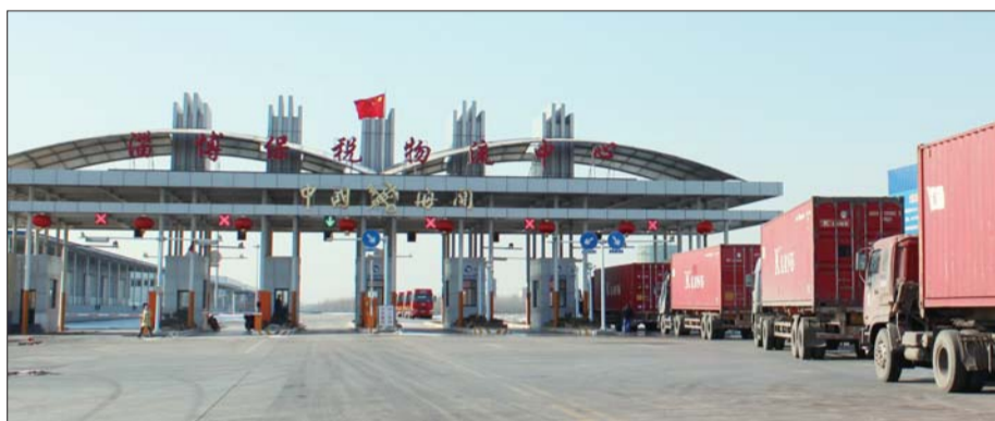
淄博保税物流中心。