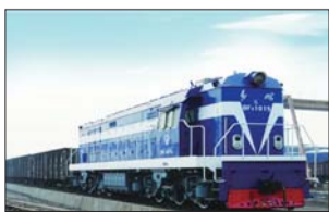
▲傅山铁路货运中心。

2015年,淄博保税物流中心将加快大宗货物仓储及国际进出口贸易等业务的发展。尽快完成50万吨棉花仓储库和分拨交易中心项目建设,并形成规模化运营;中心4座外贸仓库被全国供销社棉花交易市场批准为监管仓库。今年1月份已获得国家发改委审批成为A类仓库,可享受全国棉花交易市场仓储棉花的优先选择权,存放于此的货物如需融资,国家将给予银行利息率最低的优惠政策,下一步要利用好这一政策利好加大招商和业务拓展力度;要继续加强对淄博保税物流中心综合办公楼的招商工作,进一步整合功能与服务优势,使这一“楼宇经济”达到实效;2015年,将加快论证实施电子商务交易平台尤其是跨境电商平台的建设和推广运营。充分借助现代化技术平台的功能优势助推中心各项业务的提升,为综保区申建打好基础。