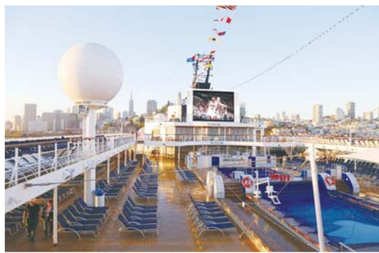
露天夜幕影院, 星光与剧情同时上映。畅游于大海之上, 感受影片里的跌宕起伏。