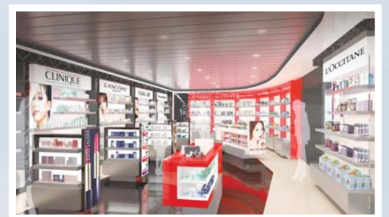
对爱美的女士来说, 这个全球最大的海上Beauty Shop, 奢侈品牌应有尽有, 让你过足购物瘾。

“天海·新世纪号”建造于德国, 等级为4.5星级, 在2006年进行了重新装修, 设施更完善, 邮轮上的管理由皇家加勒比公司接手, 确保服务品质。“天海·新世纪号”邮轮目前获得的专业评分位居中国所有营运邮轮之首。邮轮共计907个标准舱房, 可容纳2100余名游客, 露天夜幕影院里星光与剧情同时上映, 高空蹦床带您直冲高空俯视图海平面, 幸运赌场里狂欢鼎沸、纸牌翻转, 精致剧场里传统精髓与异域风情交相辉映, 更可和天王天后海上飙歌, 万人合唱响彻海平面, 更有全球最大的海上beauty shop, 奢侈品牌全汇集。