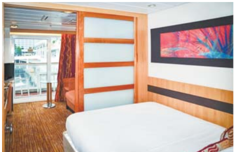
邮轮上的家庭阳台房。让您在阳台上吹着海风, 喝着咖啡, 读本小说, 惬意不已。