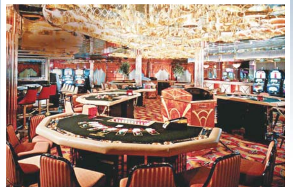
闲暇之余可以到幸运赌场试试运气, 说不定好运就会降临呢。

本报3月10日讯(记者 韩逸) 逛街怕吵, 景点太挤, 假期里, 什么选择能够不失惬意? 在国外, 在海上度假村放松身心成为新兴生活方式, 没坐过邮轮的人生开始不完整了! 今年5月29日, 齐鲁晚报爱游团邀您踏上青岛首航的天海邮轮, high遍日韩, 悦享一次完全放松的海上畅玩!