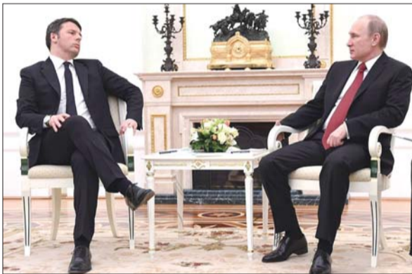
3月5日,普京在莫斯科会见到访的意大利总理伦齐。

普京、哈萨克斯坦总统纳扎尔巴耶夫和白俄罗斯总统卢卡申科原定13日在哈萨克斯坦首都阿斯塔纳举行会晤。但俄罗斯总统网站11日发布