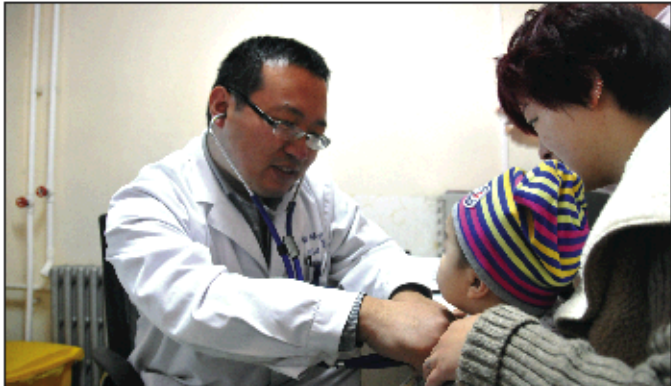
专家为每位患者细心诊断病情。