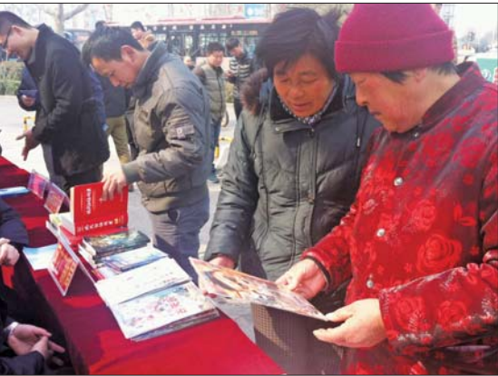
市民了解盗版光盘和书籍的危害。