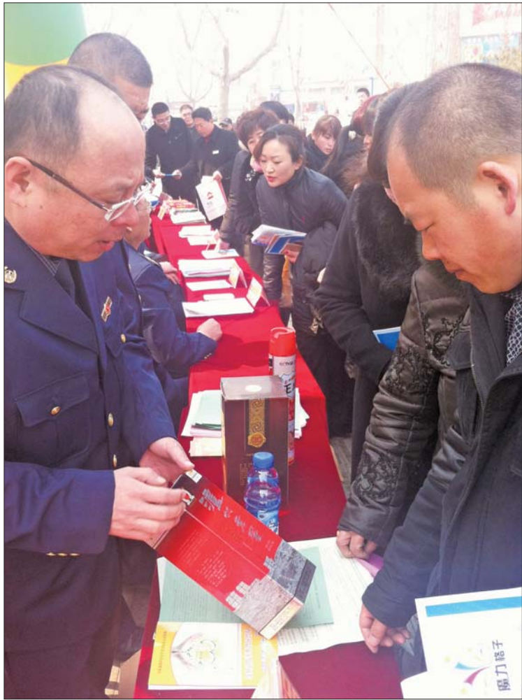
区市场监管局人员教市民辨别假酒。

本报聊城3月15日讯(记者 张召旭 通讯员 武乃峰) 13日上午,聊城市金鼎购物中心门前广场人头攒动,聊城市东昌府区3·15国际消费者权益日纪念活动在此举行。东昌府区市场监管局、区消协、食药监局、盐务局、律师咨询团等十余个部门接受市民现场咨询投诉,同时为获得2013至2014年度聊城消费者满意单位的单位进行了授牌。