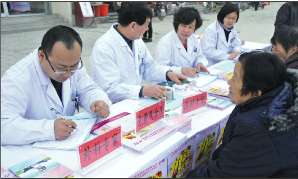
医院多次组织专家为市民义诊送健康。

十年来,分院不断优化就医环境,完善服务流程,全体医务人员精益求精,不断提升医疗服务水平,为辖区居民提供全方位、全周期的健康服务。