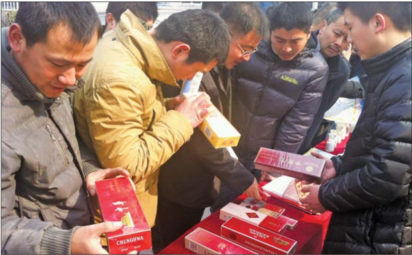
区烟草局人员教市民如何辨别真假烟。

据统计,活动当天共发放各类宣传材料2万余份,解答消费者咨询2000余人次,受到市民一致好评。